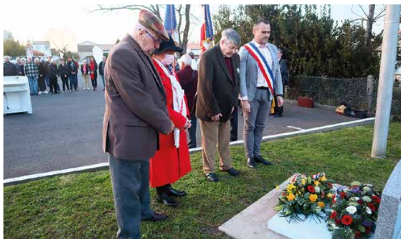
Cérémonie du 19 mars.