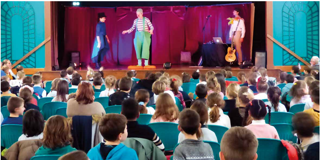
Spectacle de Noël des écoles.