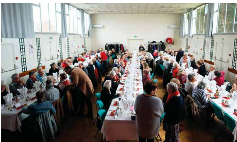
Repas des aînés de la commune.

Le 17 janvier se sont les agents communaux qui étaient réunis auprès des membres du Conseil Municipal afin de célébrer cette nouvelle année.