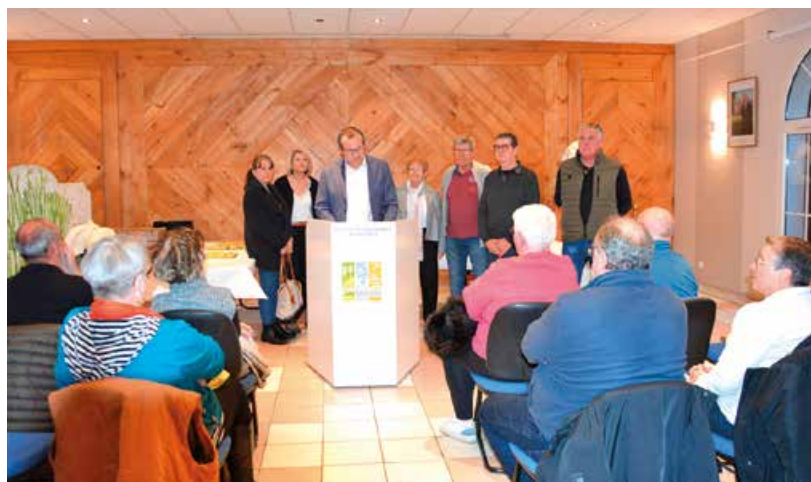
Accueil des nouveaux habitants.

La journée nationale du souvenir et de recueillement à la mémoire des victimes civiles et militaires de la guerre d'Algérie et des combats en Tunisie et au Maroc a lieu chaque année le 19 mars. Une cérémonie commémorative s'est tenue à 19 heures sur la place du 19 mars 1962.