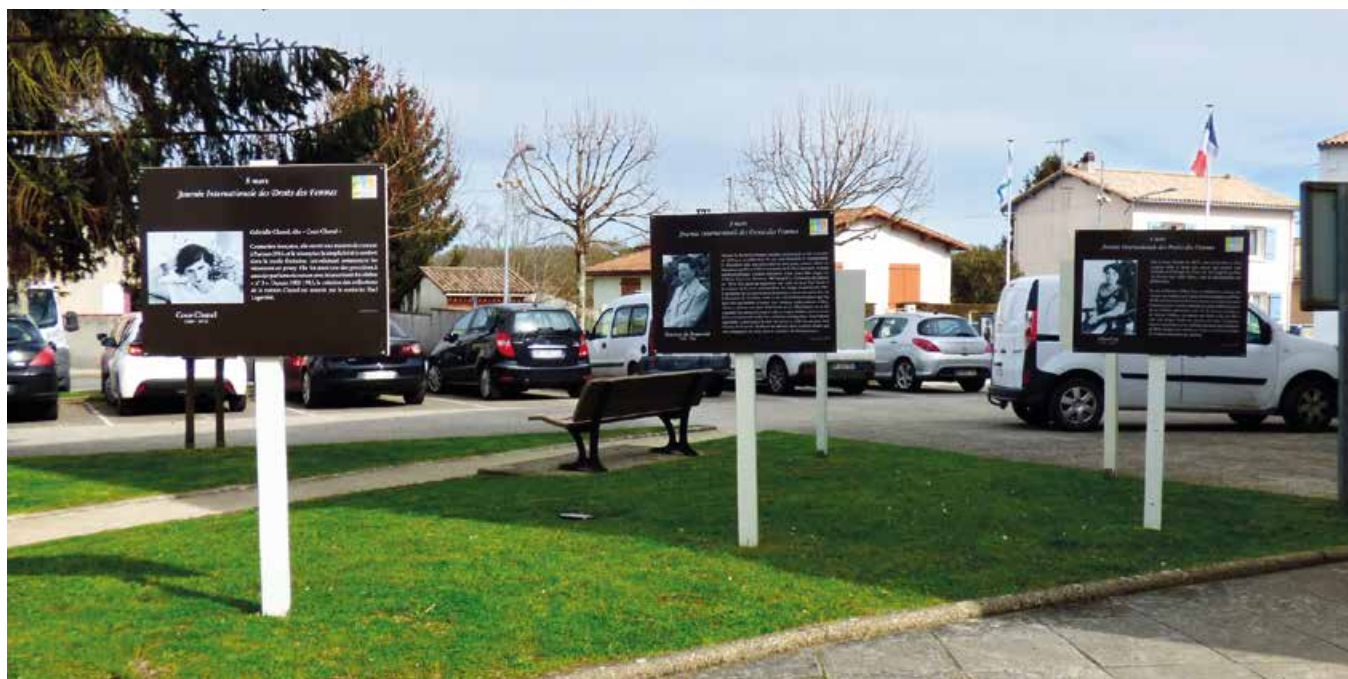
Journée des droits des femmes.