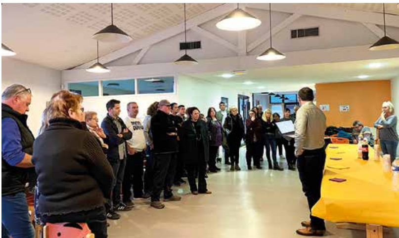
Vœux aux personnels.

La commune a offert un spectacle de Noël aux enfants de l'école primaire. Elèves et enseignants ont ainsi assisté vendredi 15 décembre à la représentation « Le Père Noël fait son cirque », interprétée par les artistes de la compagnie Soleil Nuit .